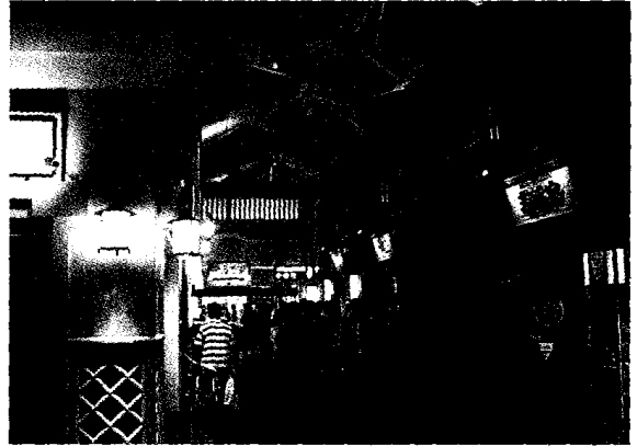
中部国際空港 ちょうちん横丁

また、新横浜ラーメン博物館、熊本ラーメン城下町、東京駅黒塀横丁、池袋福袋餃子自慢商店街、中部国際空港ちょうちん横丁、大阪滝見小路などの飲食店街やフードテーマパークでは、昭和レトロや大正ロマンをモチーフとする空間設計がなされている。なかには食品をテーマとするのではなく、台場一丁目商店街や道頓堀極楽商店街などのように昭和や大正という「古き良き時代」そのものが中心テーマとなるテーマタウンも見られる。